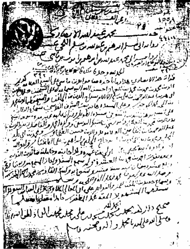
طرة نسخة دار الكتب المصرية (ج)