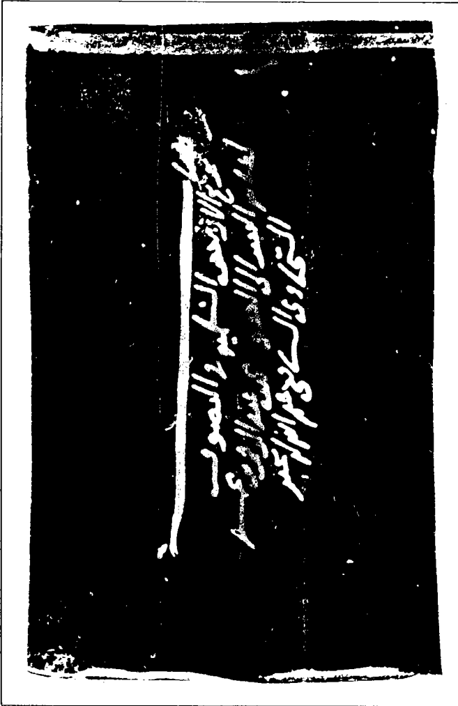
صورة عنوان المخطوطة بخط المصنف